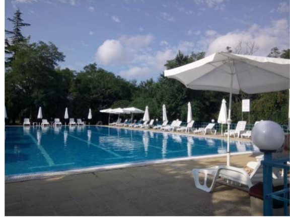
Parc et piscine de l'hôtel