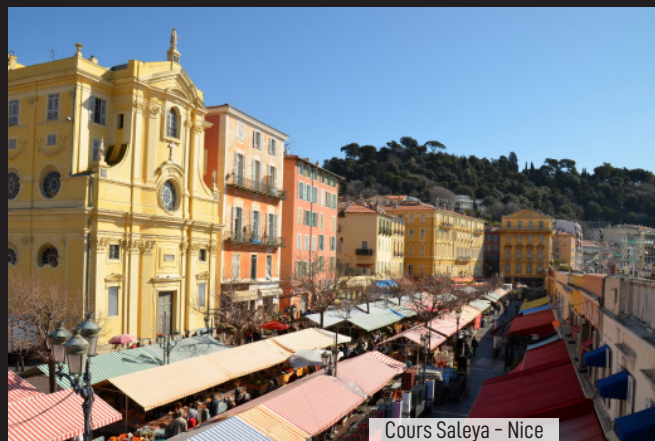
Cours Saleya - Nice