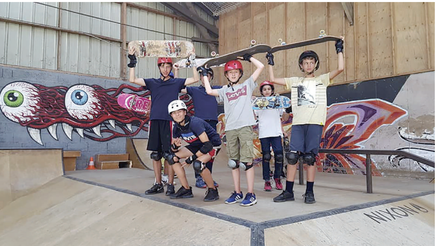
■ Offrez un séjour en colo à vos enfants pendant votre déménagement.

Igesa gère 55 structures d'accueil de jeunes enfants (2 mois et demi à 6 ans) et dispose de près de 1000 berceaux réservés dans le secteur privé ainsi que d'un réseau constitué de plusieurs milliers d'assistant(e)s maternel(le)s.