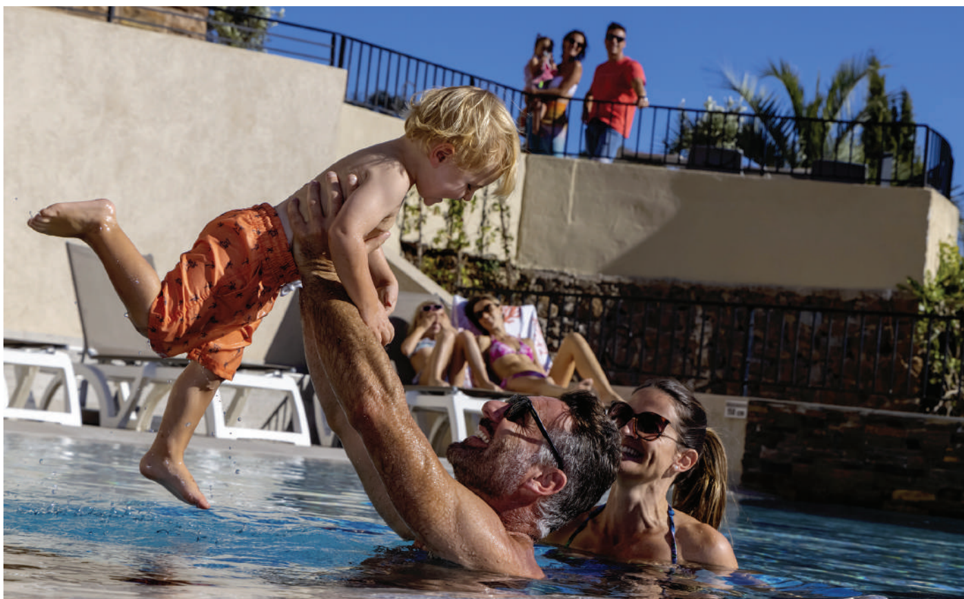
■ Avec Igesa, vos réservations vacances s'adaptent à vos besoins.

→ L'annulation de votre séjour en cas de raison de service est gratuite jusqu'à la veille du départ, pour tous les séjours réservés dans les centres de vacances Igesa.