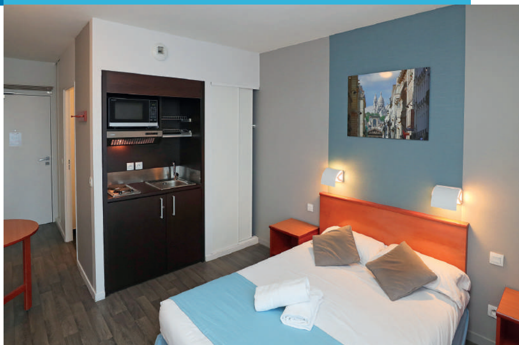
■ Une chambre double avec kitchenette à la résidence Descartes (Paris)

À Paris, Toulon et à Nice, retrouvez des logements idéalement situés, dotés de chambres tout confort. Ces établissements pratiquent des tarifs adaptés à votre type de séjour (mission, célibat géographique et agrément).