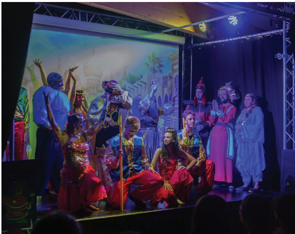
■ Soirée spectacle à Mont-Louis

La particularité Igesa ? C'est qu'on se concentre sur l'essentiel de notre métier. C'est à dire recevoir et donner du plaisir aux gens quel que soit le motif de leur séjour, et ça c'est la grande force Igesa. »