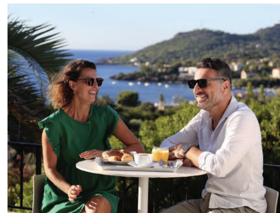
■ Petit-déjeuner sur la terrasse de l'hôtel d'Agay Les Roches Rouges

tissants et leur impact sur la famille, alors nous, nous essayons de leur faire oublier. Nous sommes une grande famille! (...) Ce métier, « si tu l'aimes pas tu l'fais pas », car ça demande énormément d'implication, parfois des sacrifices ....Et puis, il faut aimer les gens, les clients comme ses collaborateurs. L'humain c'est important dans le cœur d'Igesa. J'ai aussi la chance de disposer d'un établissement entièrement rénové depuis 2022 avec piscine et classifié « premium », c'est vraiment une belle structure. Deux mots pour caractériser ce métier ? magicien des rêves. On est ce que les gens attendent de nous pour oublier leur quotidien et passer de bons moments. ”