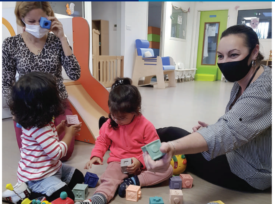
■ Des solutions de garde d'enfant qui s'adaptent à vos contraintes.

Les villes d'arrivée et de départ peuvent être différentes, pensez-y au moment de la réservation de son séjour !