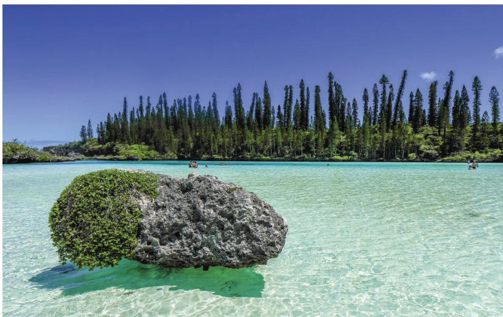
■ Le village vacance de Kuto, un site unique dans un décor de rêve.

Malgré l’éloignement qui reste une contrainte sociale et opérationnelle quotidienne, le soutien du siège est permanent. ”