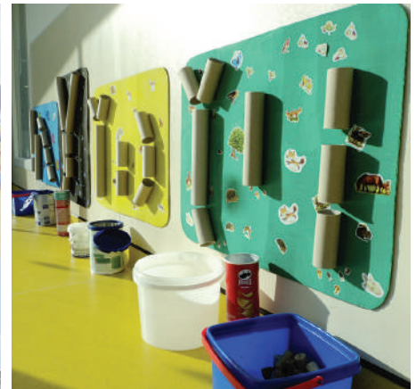
■ Activités artistiques