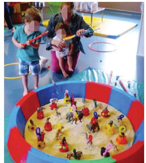
■ Activités avec les parents

Porter au plus haut la qualité d'accueil des enfants confiés à Igesa tout en soutenant la croissance du parc d'établissements gérés par l'institution.