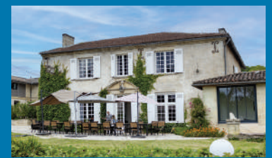
■ La maison ATHOS à Cambes (33) est la première maison à avoir ouvert début 2021.

Ce dispositif s'inscrit dans le cadre du plan d'action ministériel visant à « contribuer au rétablissement et favoriser une meilleure réhabilitation psychosociale des militaires blessés.