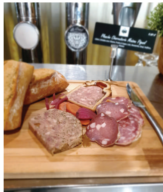
La terrasse ■ Planche charcuterie et présentation salade du QG ■