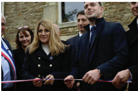
■ Inauguration de la maison ATHOS de Pluneret par Patricia Mirallès, secrétaire d'État auprès du ministre des Armées, le 27 avril dernier.

Dans un parc calme et préservé de plus d'un hectare, la maison Athos de Pluneret est une magnifique demeure granitique propice à soigner ces blessures invisibles. D'une capacité de 30 personnes, elle dispose de nombreux équipements : piscine, salle de sport, salle d'activités, atelier de bricolage, etc.