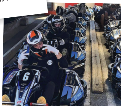
QUIBERON 13-17 ANS PRÊTS À S'ÉLANCER SUR LA PISTE DE KARTING