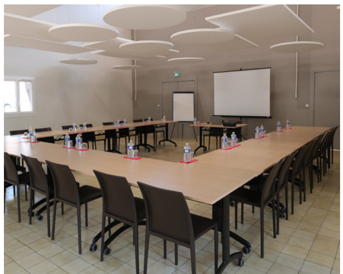
■ L'établissement de Fréjus, lieu d'accueil privilégié dans le cadre du Dispositif de Fin de Mission (DFM) et des épisodes de quatorzaine "départ et retour d'OPEX".