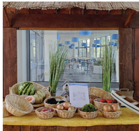
■ Au camping du Pin-de-Galle dans le Var, un mini-marché vous propose les produits de producteurs locaux.