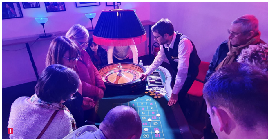
1 La soirée "Casino" organisée par Igesa (DRI Armorique), à la demande du comité social de la Base de Défense de Brest-Lorient.

La relation de confiance ministérielle accentuée lors de cette période si particulière réaffirme la capacité de l'institution à devenir un outil opérationnel performant à disposition des forces armées.