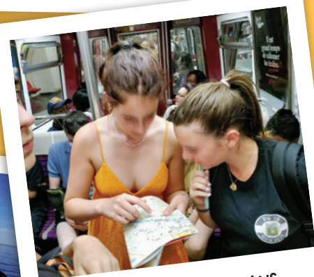
PARIS-VOLTAIRE 15-17 ANS À LA DÉCOUVERTE DE LA CAPITALE !