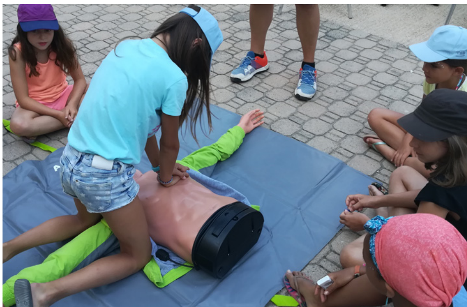
■ Ateliers prévention CNMSS/TEGO dans les établissements de vacances Igesa

A noter également qu' Igesa soutient aussi de nombreuses associations militaires locales ainsi que des équipes sportives de haut niveau (accueil dans ses établissements de l'équipe de France militaire de cyclisme à Agay 2021, d'athlétisme à Hyères en mars 2022 et d'escalade à Puy St Vincent en juillet 2022...) Ainsi, de par sa vocation, son expertise et sa capacité à répondre avec réactivité et efficacité aux évolutions constantes du milieu défense, Igesa s'est assurément et légitimement imposée comme l'opérateur social du ministère des Armées, facilité en cela par son statut qui lui permet d'intervenir sur simple demande ministérielle.