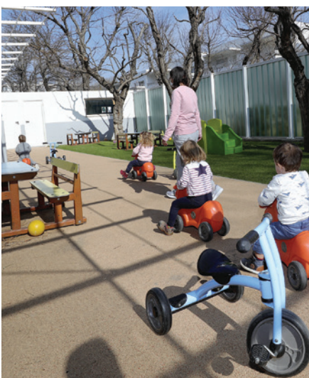
■ Etablissement de Jeunes enfants "Les Pirouettes" à Marseille.

Cette offre d'accueil est complétée par un dispositif de réservation de berceaux (plus de 859 places) et par un accès gratuit à Yoopies, plateforme numérique de services à domicile (sortie d'école, babysitting, garde à temps plein, aide aux devoirs, etc.) qui facilite la mise en relation entre les familles et les intervenants.