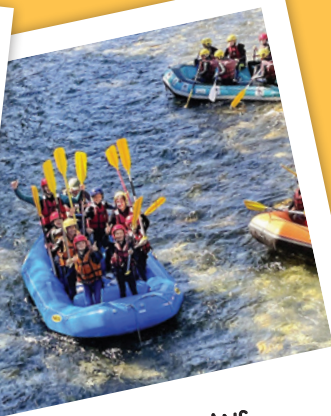
GARIN 12-14 ANS SORTIE RAFTING