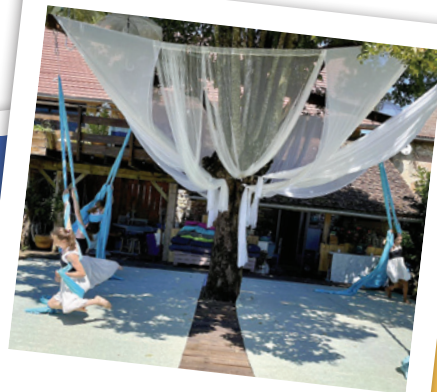
ENTRE DEUX GUIERS 9-14 ANS LA VALSE DES RUBANS : ACROBATIE AÉRIENNE