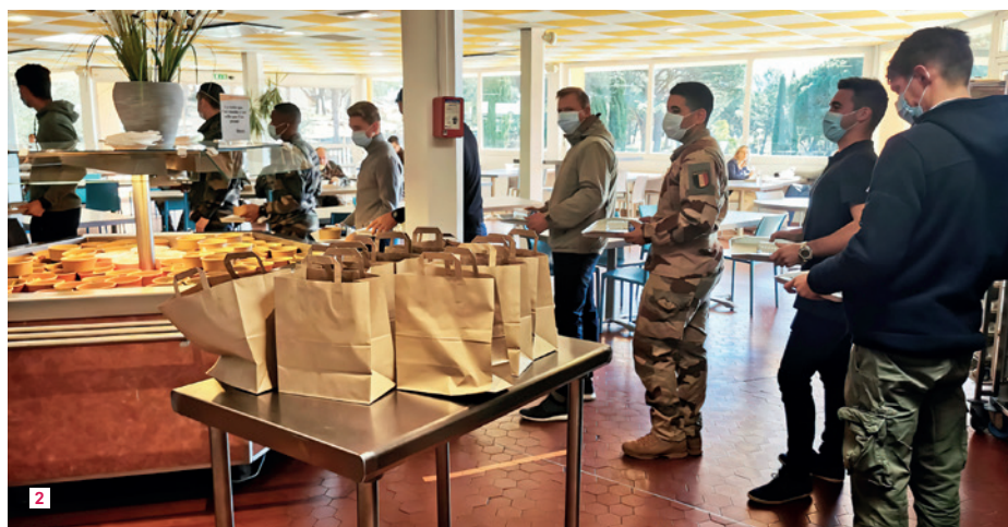
2 Au plus fort de la pandémie, Igesa a mis à disposition plusieurs de ses établissements pour accueillir des unités.

nation auprès de la jeune génération, Igesa a tenu à encourager le projet SNU (Service National Universel). Les 3 engagements soutenus par le SNU (faire vivre les valeurs républicaines, renforcer la cohésion nationale, développer une culture de l'engagement), s'inscrivent en effet en droite ligne dans les valeurs défendues par l'institution.