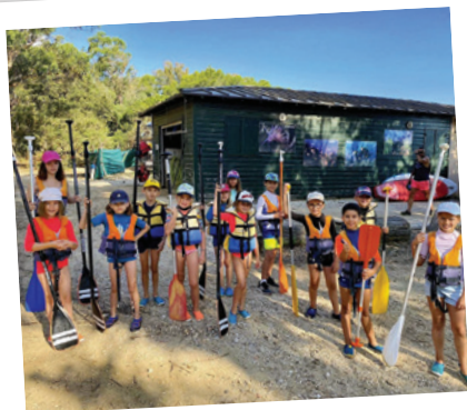
PORQUEROLLES 6-11 ANS PARÉS POUR UNE BELLE AVENTURE EN MER !

D ans une ambiance joyeuse et sécurisante, les équipes d'animateurs des colos Igesa, s'emploient à faire rêver vos enfants l'espace d'un été et à leur construire leurs plus beaux souvenirs !