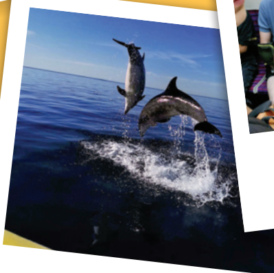
BERTHEAUME 6-11 ANS DÉCOUVERTE DES MAMMIFÈRES MARINS