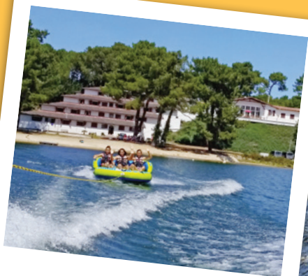
BISCARROSSE 12-14 ANS CHORÉGRAPHIES DU MATIN SUR LE LAC POUR LES ADOS DU GROUPE DE SKI NAUTIQUE.