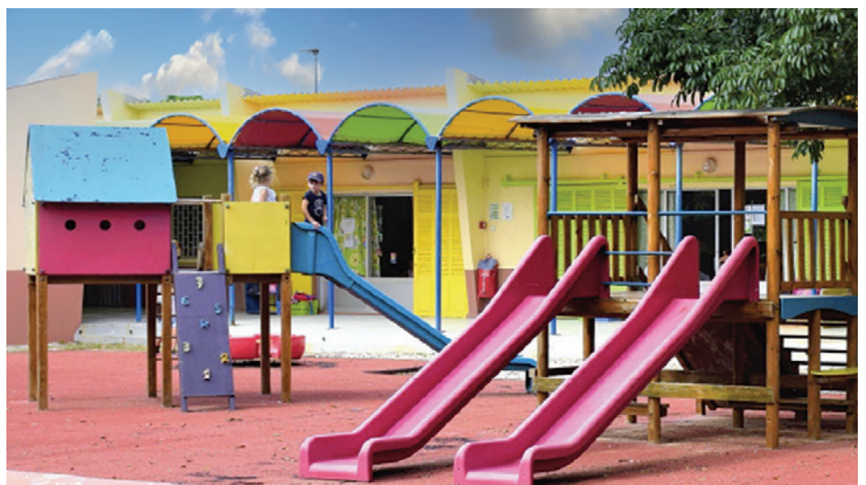
■ Jardin d'enfants à Dakar.