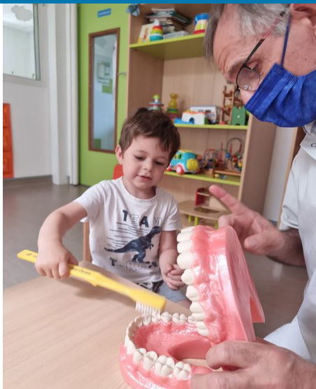
■ Des enfants très intéressés et enchantés de pouvoir manipuler cette impressionnante dentition !

Défense au profit des militaires en OPEX ou OPINT. Outre le soutien financier qu'elle y apporte, Igesa réaffirme par cet engagement, son attachement et sa mobilisation aux côtés des soldats déployés. Chaque année, 12 000 colis apportent réconfort aux soldats mobilisés sur le terrain et loin de leur foyer.