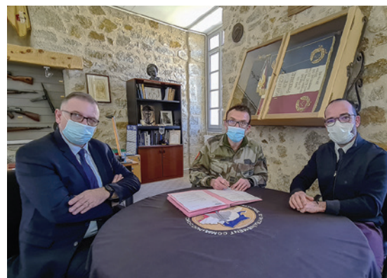
■ Ci-dessus, de gauche à droite : signature d'une convention de jumelage entre le 13 BSMAT et l'établissement d'Enval. Une autre convention a été signée entre le CNEC et l'établissement de Mont-Louis.

Depuis quelques mois, dans le cadre du recentrage de l'action d'Igesa vers les armées, l'institution a engagé une vaste campagne de jumelage entre les établissements familiaux et les unités militaires de proximité.