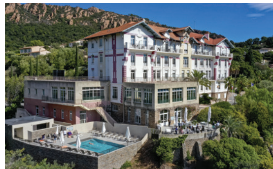
L'établissement d'Agay-Les Roches Rouges a accueilli le dernier conseil de gestion de l'institution, au mois de juillet 2022.