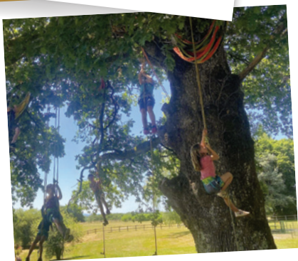
BEYSSAC 6-11 ANS JEU D'ACROBATIES À L'OMBRE D'UN ARBRE CENTENAIRE