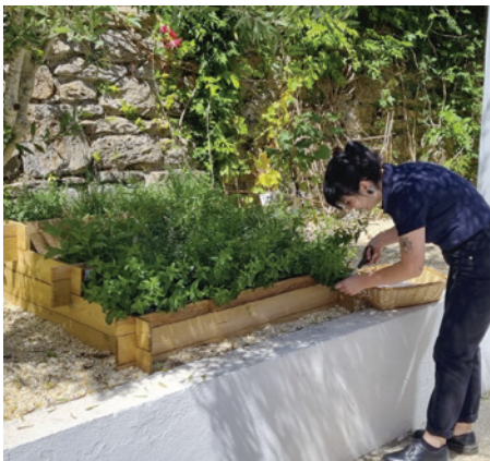
■ Quiberon dans le Morbihan, les aromates qui agrémentent vos assiettes sont bio et proviennent du carré potager de l'établissement.

Les salariés d'Igesa deviennent acteurs dans la mise en place d'actions adaptées à leur structure. Les mesures et initiatives existantes ou à venir renforcent le plan anti-gaspi 2022-2023, un plan ambitieux, efficient et opérationnel, visant à améliorer la résilience de l'entreprise face aux pics de consommation dès 2022.