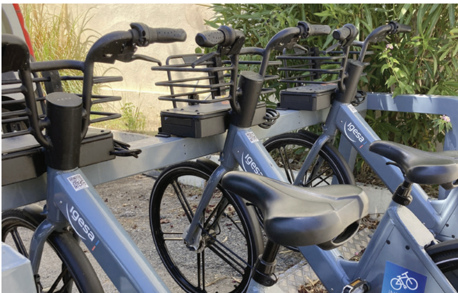
■ Igesa veille à développer l'utilisation du vélo électrique : ainsi, au sein du siège national Igesa situé à Bastia (Haute-Corse), des vélos électriques ont été mis à disposition des salariés. Les établissements d'Agay (Var) et de la Marana (Haute-Corse) ont également été équipés pour les vacanciers.