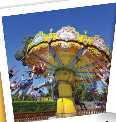
ANDERNOS 6-11 ANS JOURNÉE SENSATIONS AU KID PARC !

Plus que des longs discours, retour en images sur la saison été 2022.