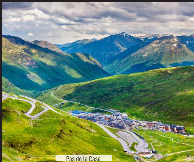
Pas de la Case