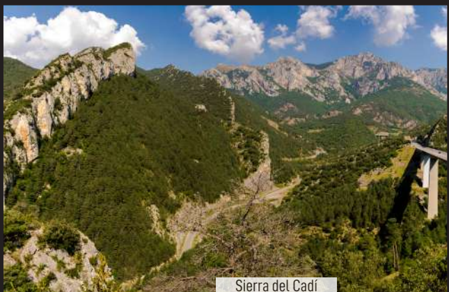
Sierra del Cadí