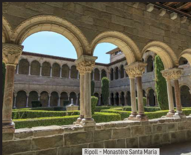
Ripoll - Monastère Santa Maria